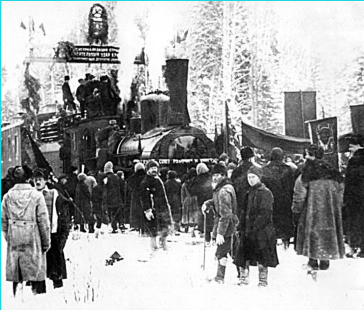
Как строили железную дорогу Зеленый Дол - Краснококшайск.