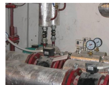
ЖК по ул. Калараш, ул. Малышева 5 и