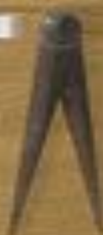
Label for the long-handled pliers.