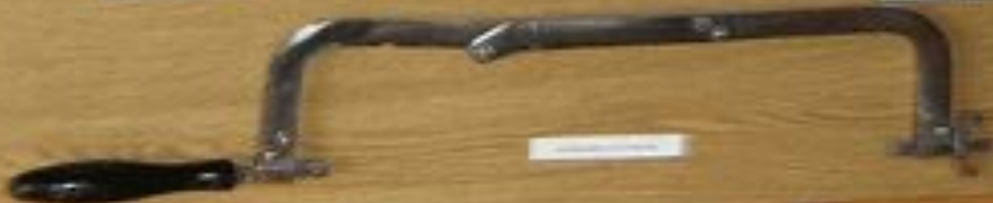
Label for the large complex tool.