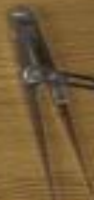
Label for the compasses.