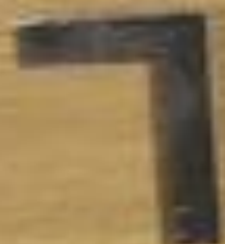
Label for the L-shaped tool.