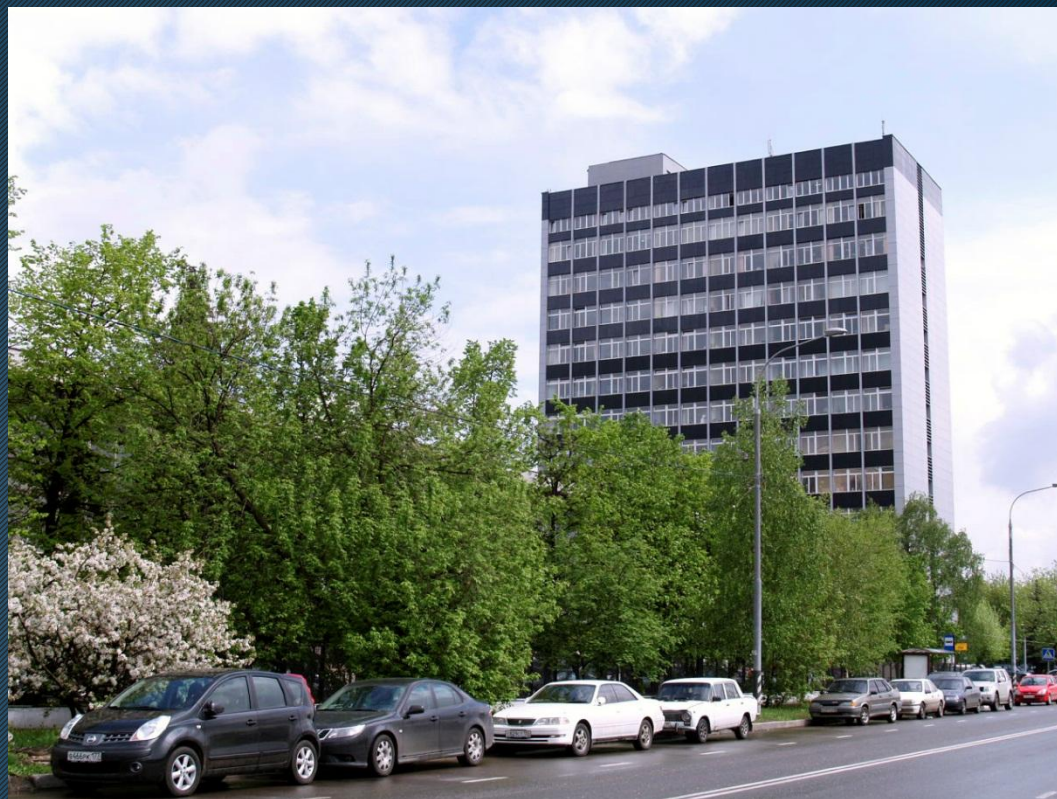
Вид фасада с улицы Красная Сосна