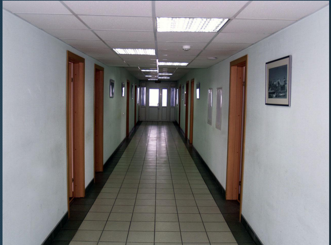
Офисный блок кабинетного типа