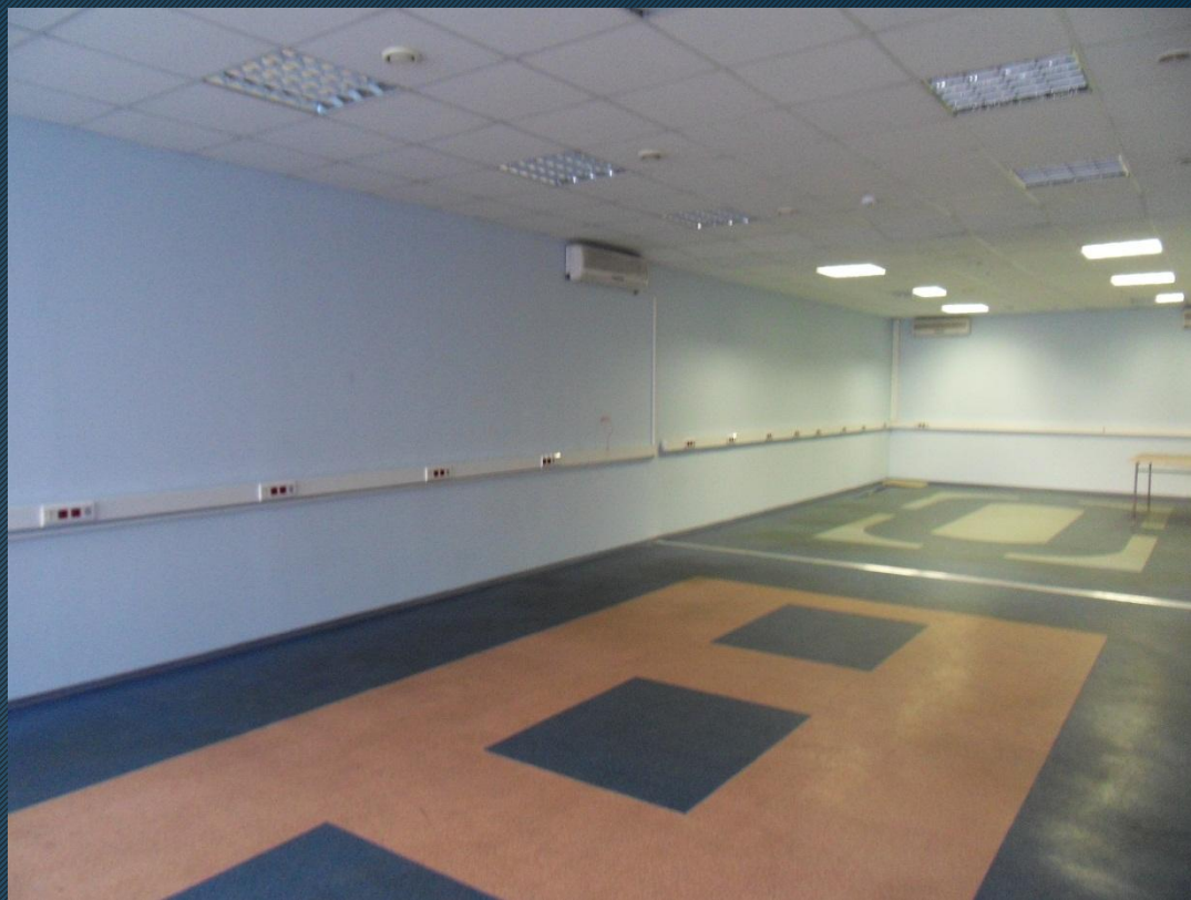
Офис свободной планировки