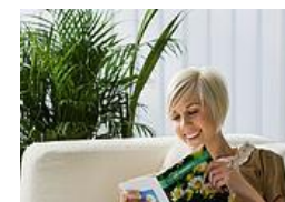
В очереди в поликлинике