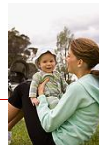
На улице во время прогулки