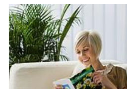
В очереди в поликлинике