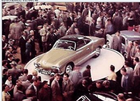
Премьера VW Karmann-Ghia на салоне 1953 года.