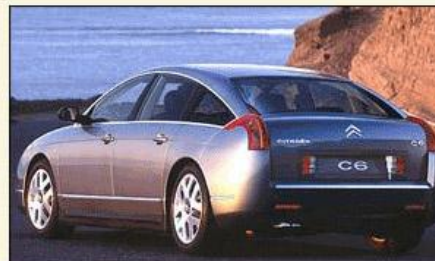
Фото дня: Citroen C6

порадует Volkswagen. Одна из самых интересных премьер - Concept R. С его помощью VW хочет показать, что он почти как BMW - делает престижные машины со спортивным характером.