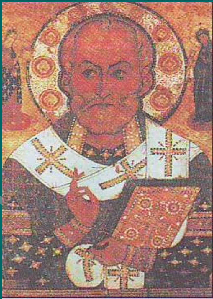
Святой Николай Чудотворец. Икона. Новгород.