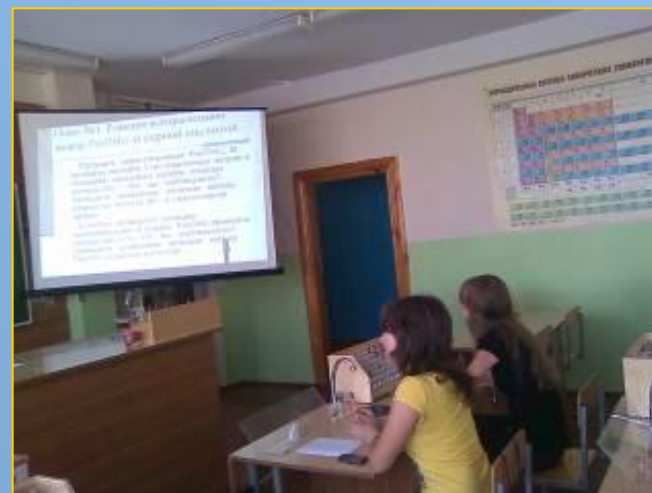
Фрагмент урока для руководителей школ и района