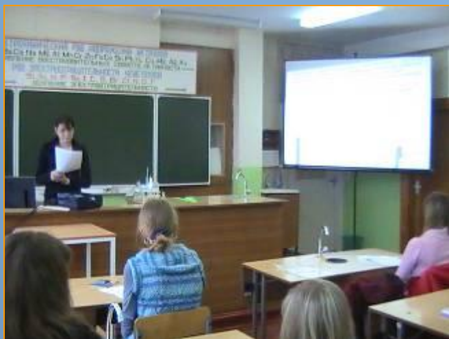
Школьная экологическая конференция