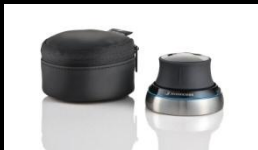
SpaceNavigator for Notebooks

Программное обеспечение используется менее 5 ч. в день Можно использовать как дома, так и в офисе Подходит для пользователей Mac