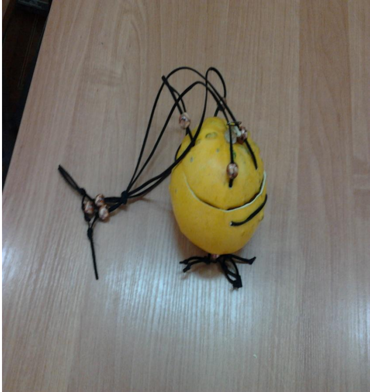
БИОСУМКА СЕМЬИ ЧУПИНЫХ