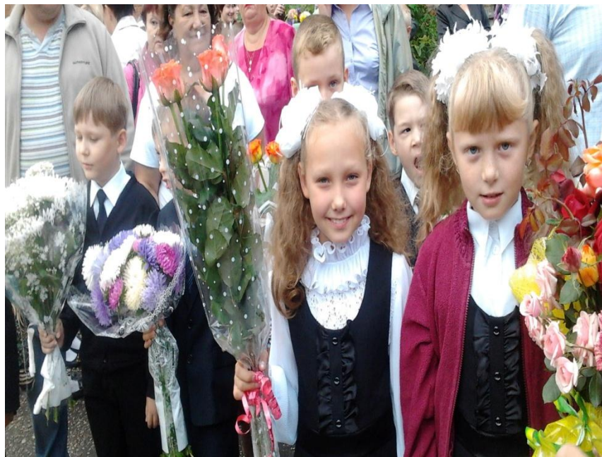
ДЕТИ И РОДИТЕЛИ