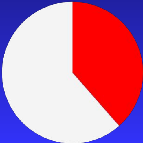
Govt. spending - Singapore