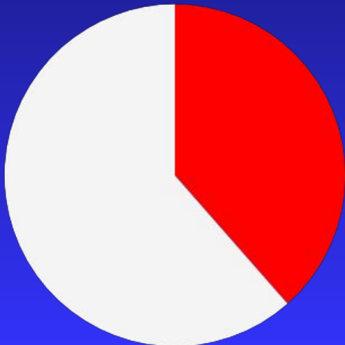
Govt. spending - Georgia