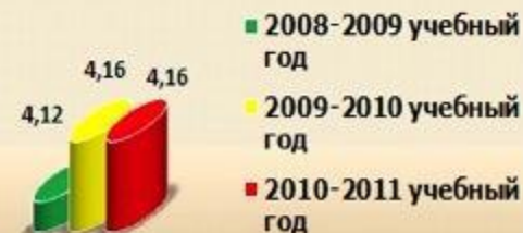
Уровень успешности физической подготовленности учащихся