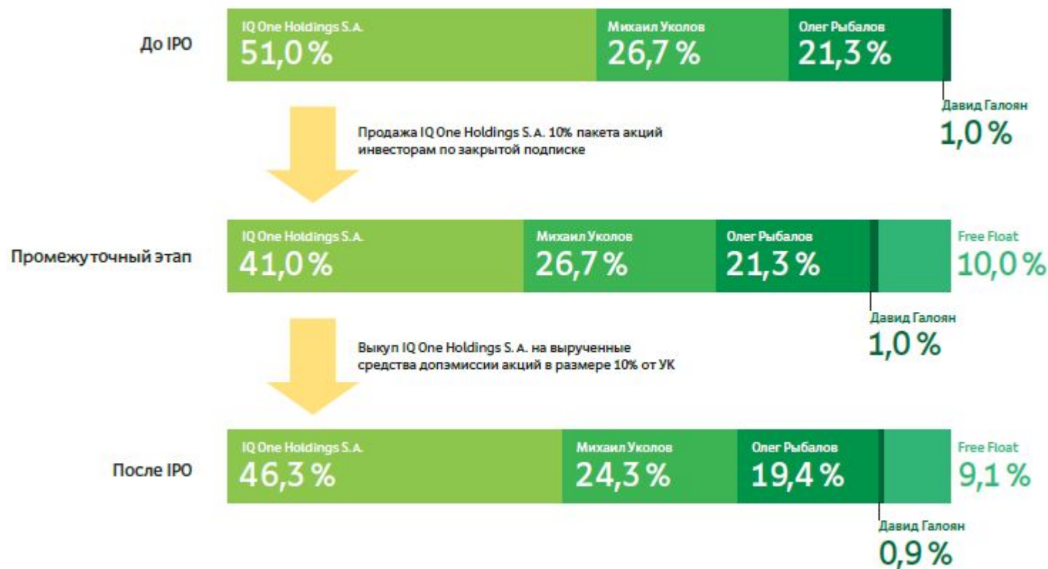
Схема привлечения финансирования