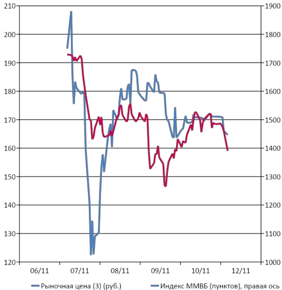
Динамика котировок акций ОАО "Платформа ЮТИНЕТ.РУ"