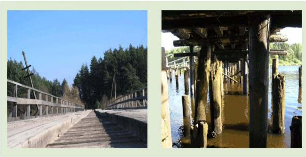
Мост сверху и снизу. Пример того, как важно рассматривать организацию с разных позиций

Для понимания окружения организации большое значение имеет позиция, с которой вы его рассматриваете. У вас будет собственный взгляд на окружение организации в зависимости от того, являетесь ли вы рядовым сотрудником, менеджером, потребителем, собственником, акционером или конкурентом.