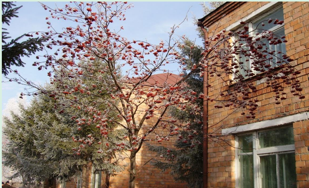
Районная базовая площадка на базе МБДОУ № 8