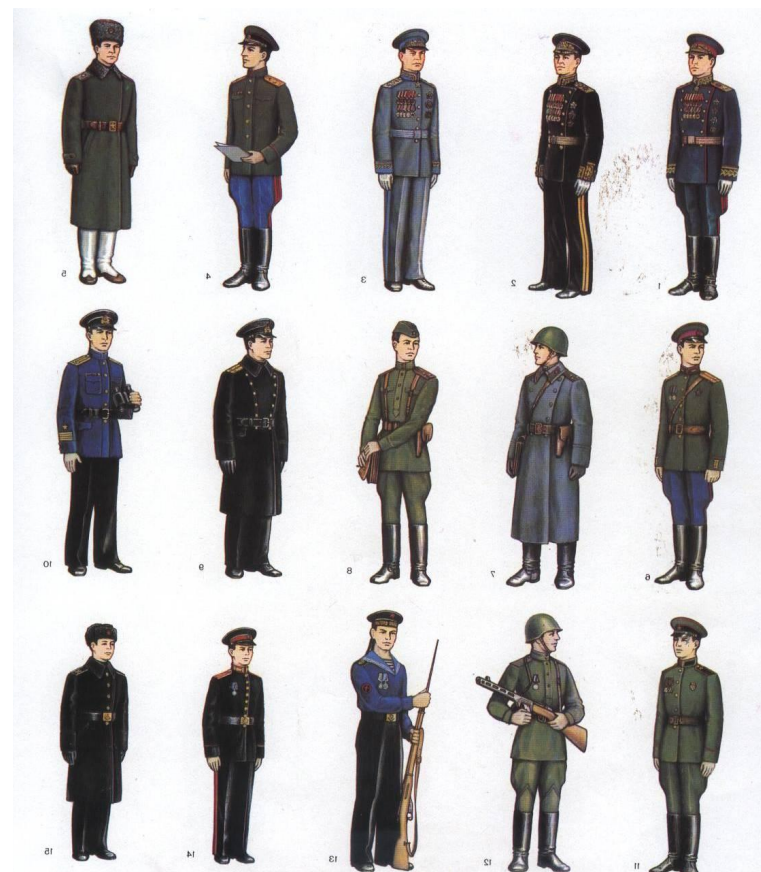
После введения погон (после 1943 г.)