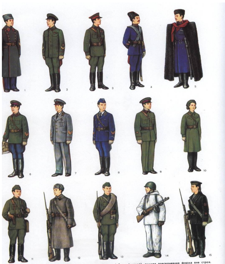
До введения погон (до 1943 г.) г.)