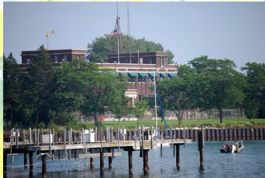
Уокиган - родной город Брэдбери