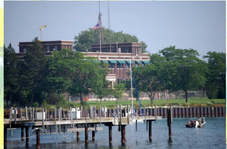
Уокиган - родной город Брэдбери