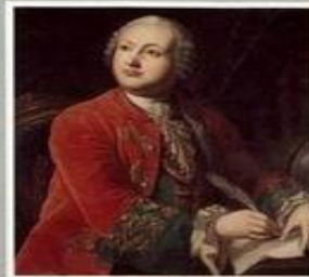
М.В.Ломоносов. Неизвестный художник XVIII в. Архангельская областная краеведческая музей

Ломоносов считал химию своей «главной профессией», причем развитие химии, по мнению ученого, должно было помочь решению практических задач. «Истинный химик должен быть теоретиком и практиком», — писал он. Став профессором химии, Ломоносов начал добиваться создания химической лаборатории.