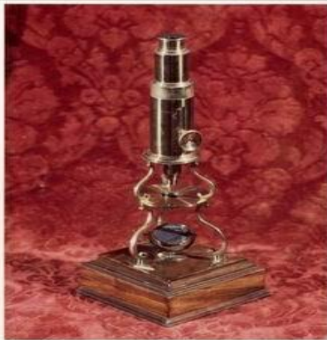
Микроскоп XVIII в. Музей М.В.Ломоносова. Литомограф

Ломоносов считал химию своей «главной профессией», причем развитие химии, по мнению ученого, должно было помочь решению практических задач. «Истинный химик должен быть теоретиком и практиком», — писал он. Став профессором химии, Ломоносов начал добиваться создания химической лаборатории.