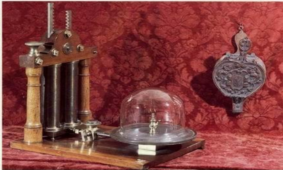
Взвешивальный аппарат XVIII в. Музей М.В.Ломоносова. Литомограф

Вещи из химической лаборатории М.В.Ломоносова