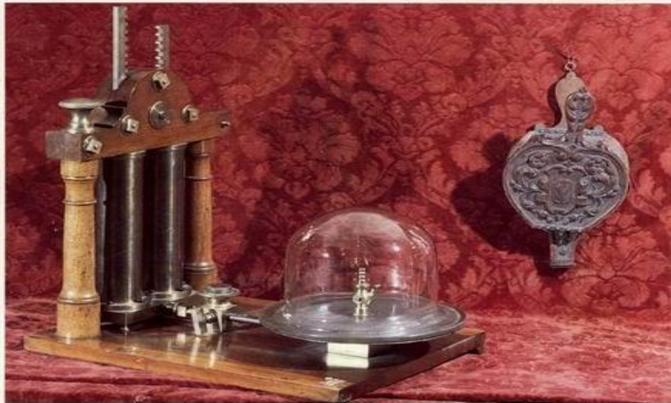
Вспомогательный аппарат XVIII в. Музей М.В.Ломоносова. Литомграфия

Ломоносов считал химию своей «главной профессией», причем развитие химии, по мнению ученого, должно было помочь решению практических задач. «Истинный химик должен быть теоретиком и практиком», — писал он. Став профессором химии, Ломоносов начал добиваться создания химической лаборатории.