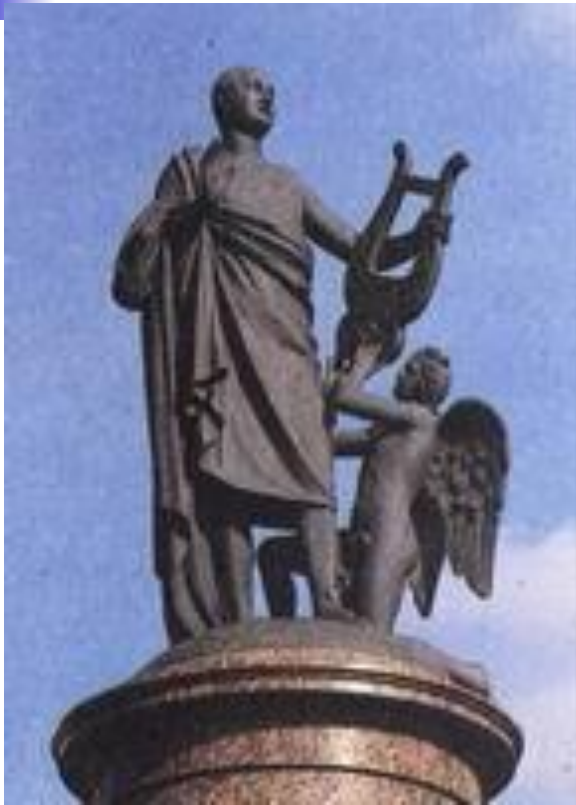
Памятник Ломоносову в г. Архангельске