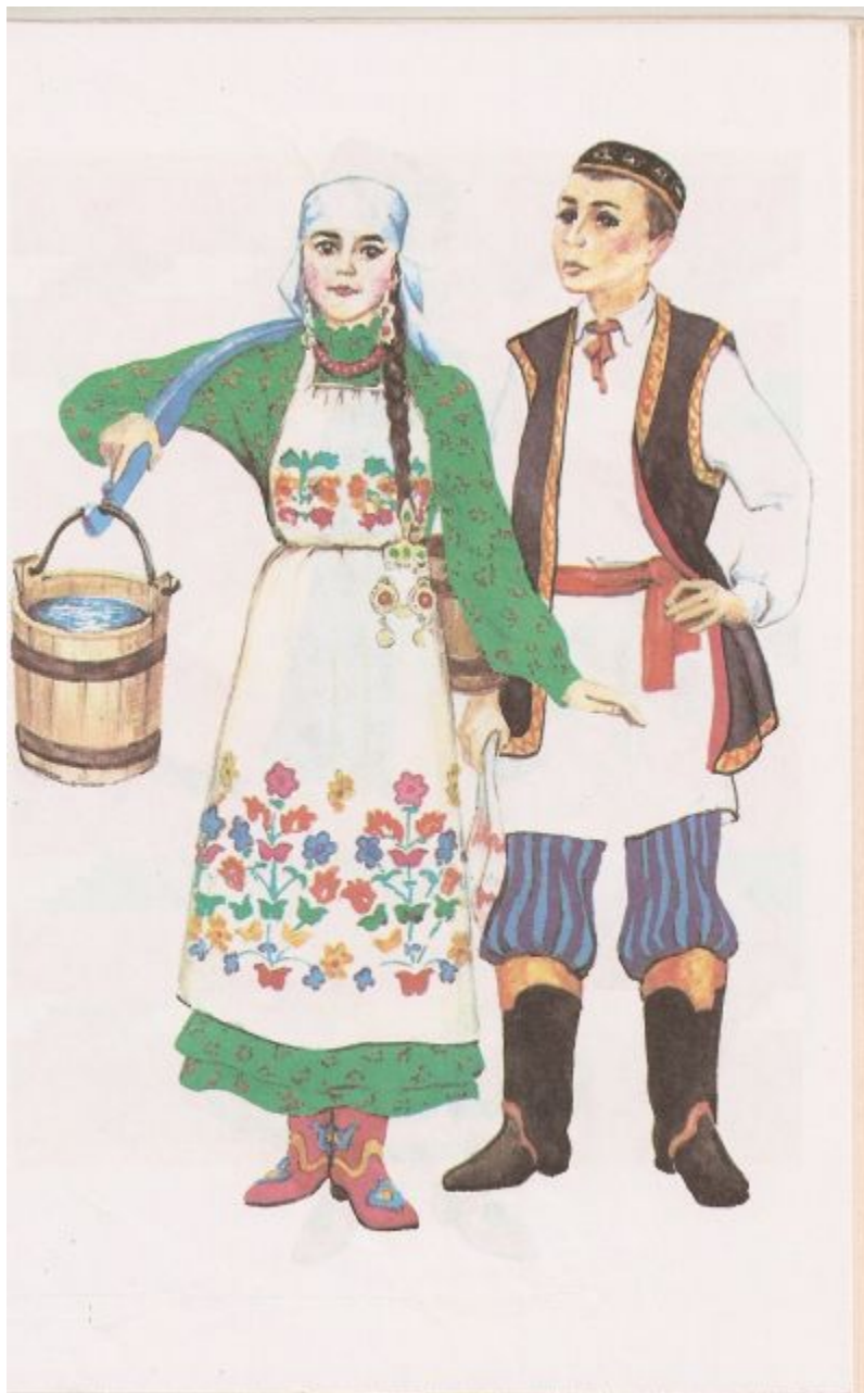
Татарская национальная одежда