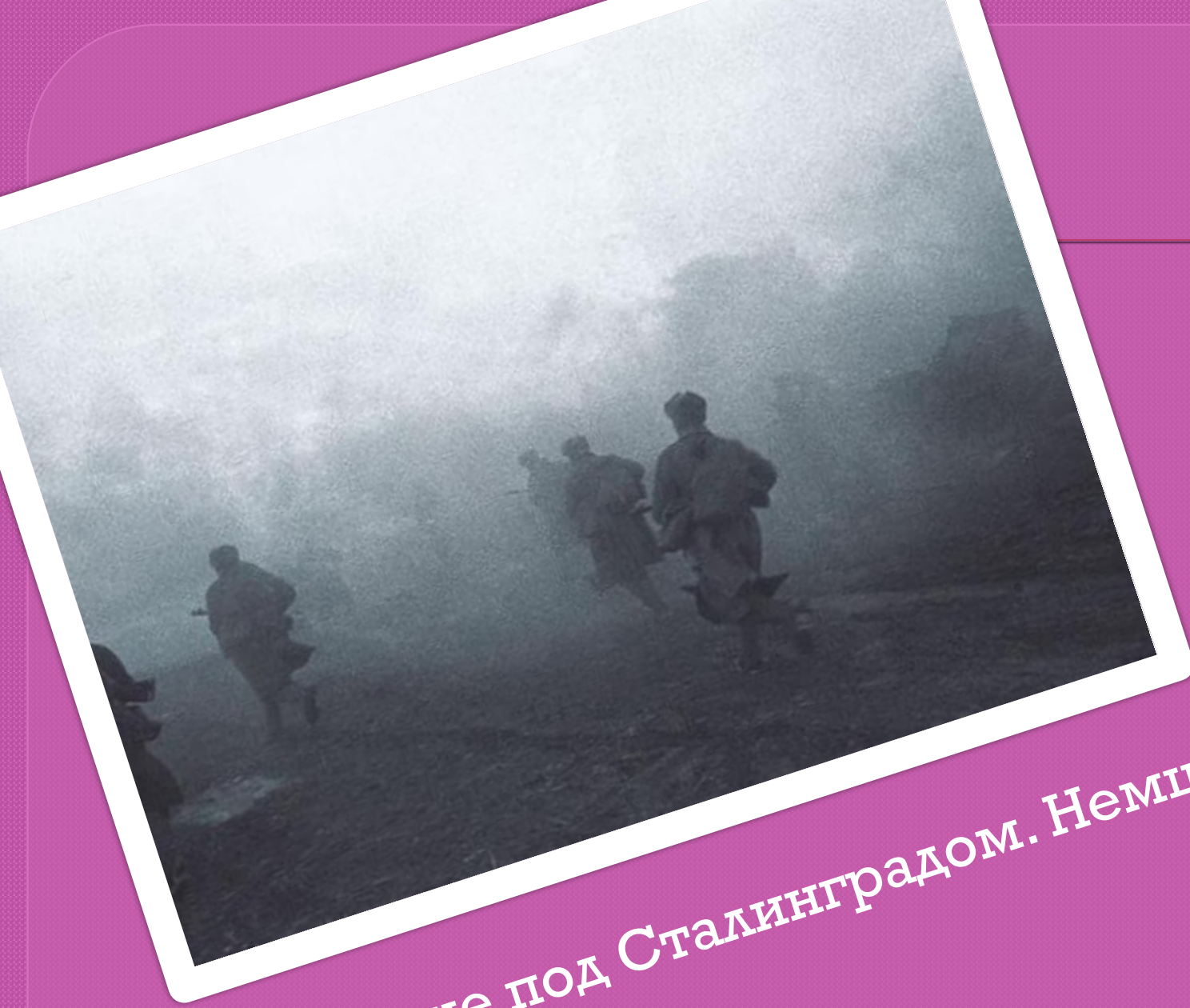
Сражение под Сталинградом. Немцы убегают.