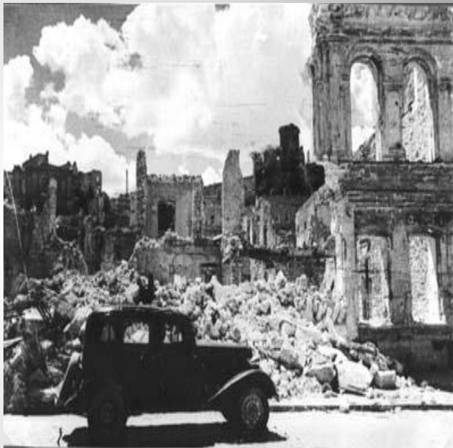
В разрушенном Севастополе 1944 года.

Защитников города постоянно поддерживали корабли флота. Прорываясь в осажденный Севастополь, они доставляли пополнения, боеприпасы, продукты питания, увозили на Большую землю раненых, стариков, женщин и детей, вели артиллерийский огонь по позициям врага. А когда надводные корабли уже не могли прорываться к Севастополю, их задачу отважно выполняли экипажи подводных лодок. Несгибаемое мужество и само отверженность проявили в дни обороны медицинские работники флота и города. За 8 месяцев обороны они спасли жизни десяткам тысяч людей, возвратили в строй 30927 раненых и 10686 больных.