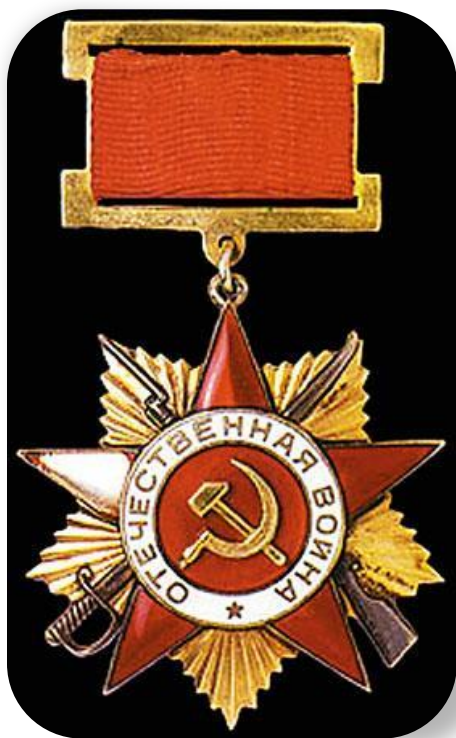
Орден Отечественной войны I степени