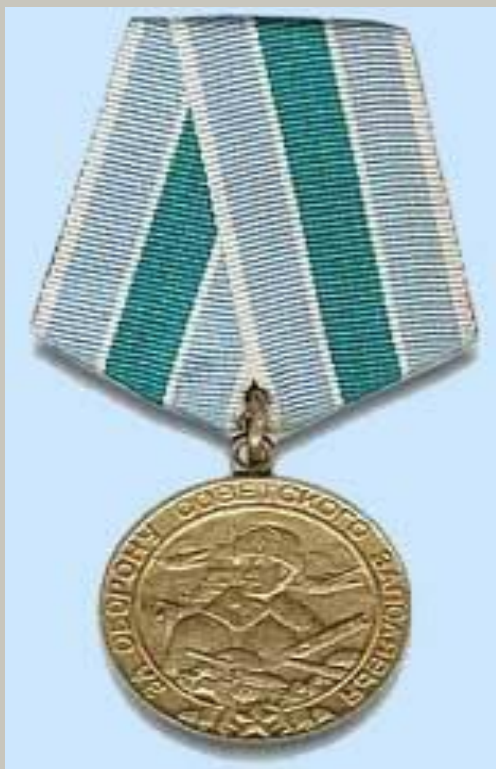
Медаль «За оборону Советского Заполярья»