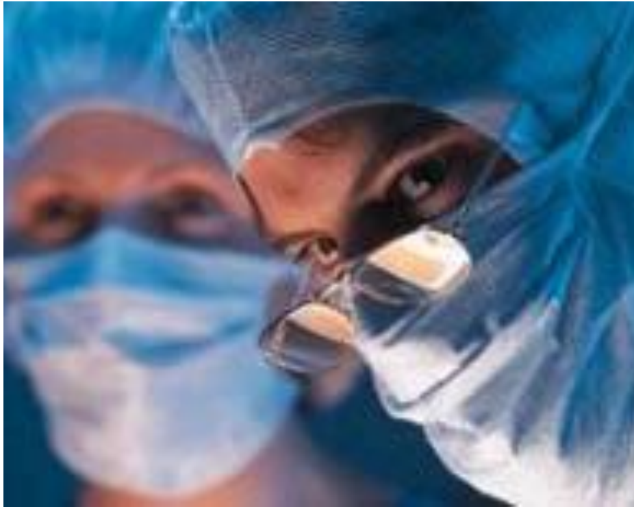
Медицинская реабилитация инвалидов по зрению