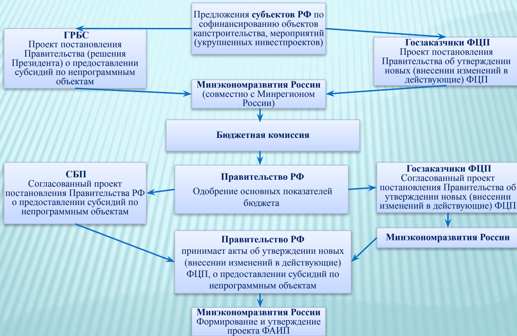
Схема принятия решений о предоставлении субсидий на софинансирование объектов (в т.ч. адресно расшифрованных в ФАИП)