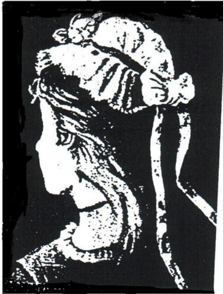
Леди и старуха