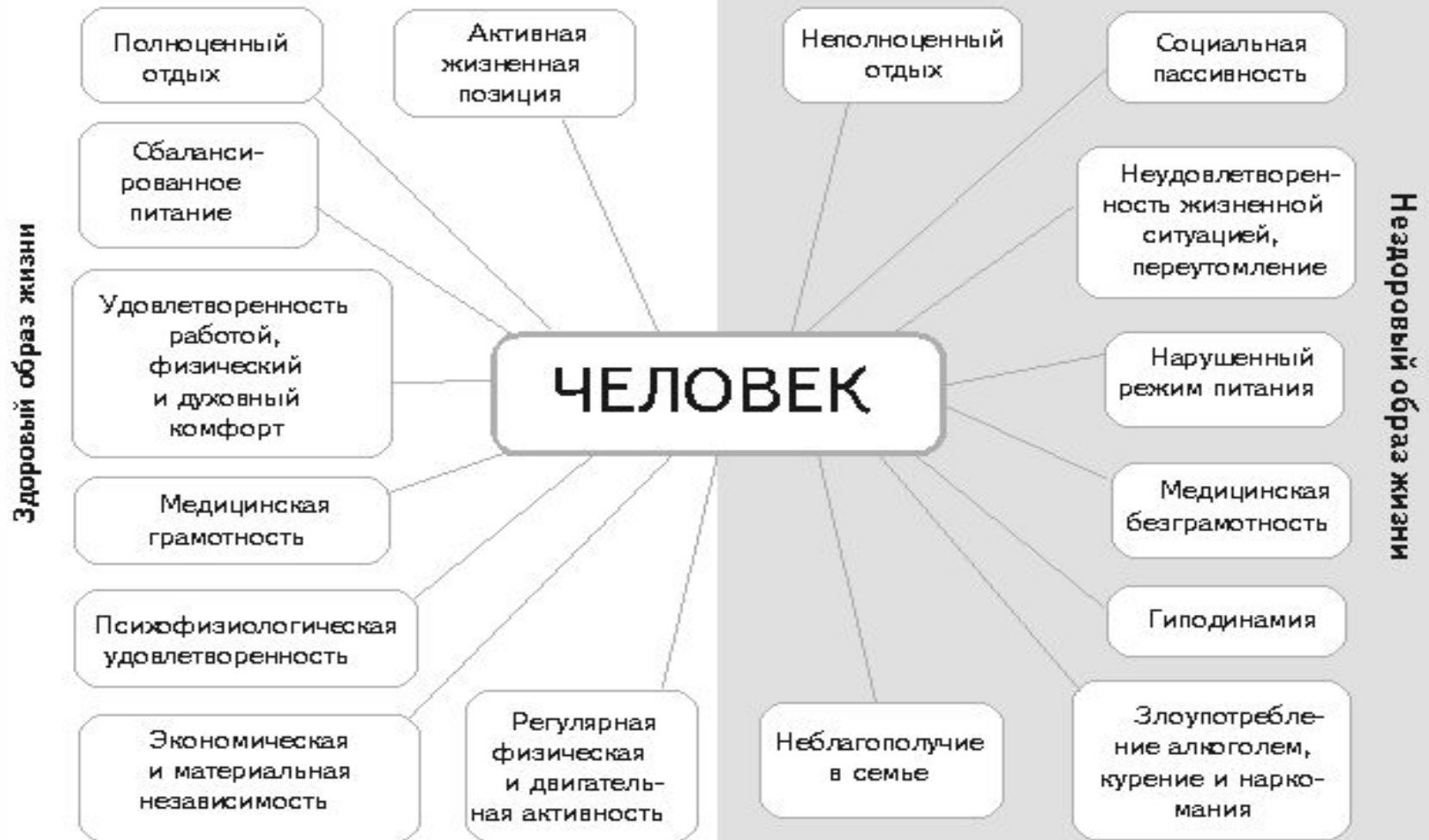
Схема «Здоровый образ жизни»