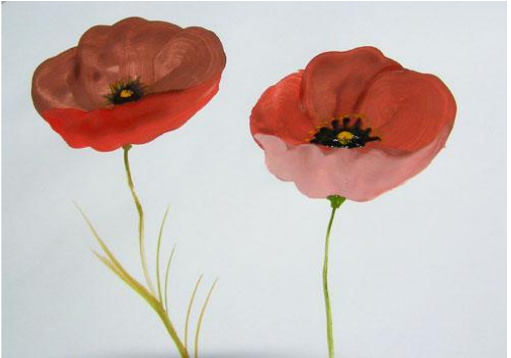
Рисуем ножку , листочки