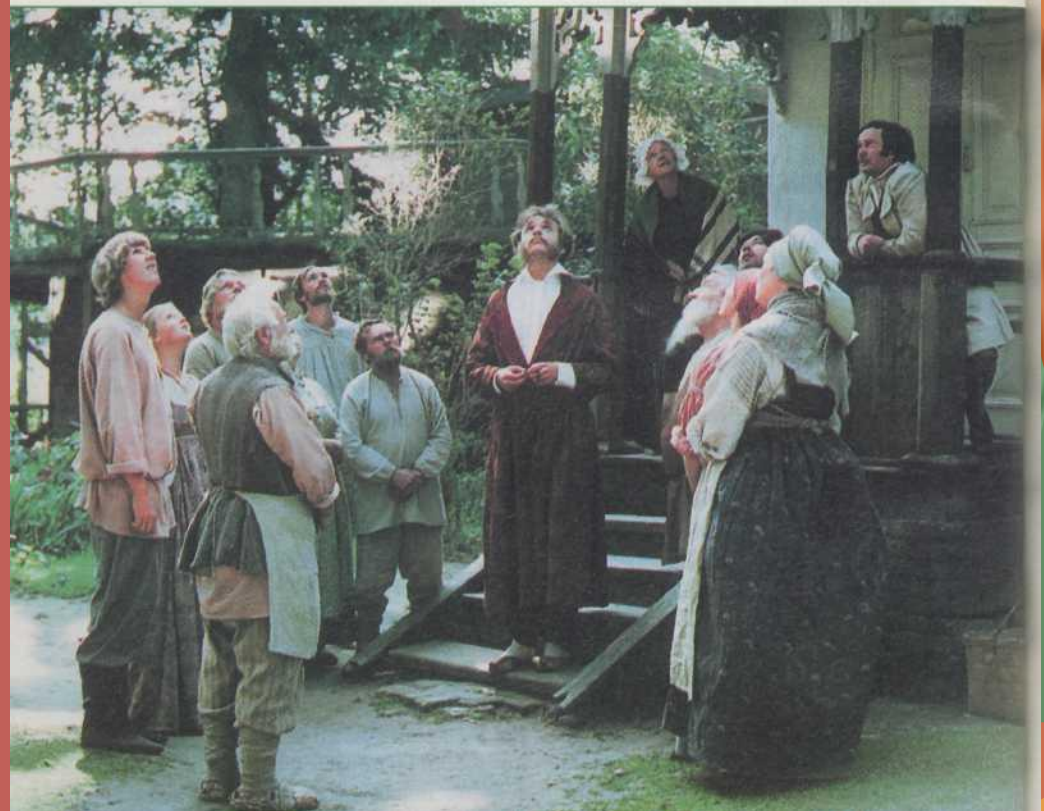
Кадр из фильма “Несколько дней из жизни И.И.Обломова”. Режиссер Н.С.Михалков. 1980

Почему Обломов любит крапивой, рябиной у дома Пшеницыной, предпочитает тихую, спокойную местность и деревенский быт?