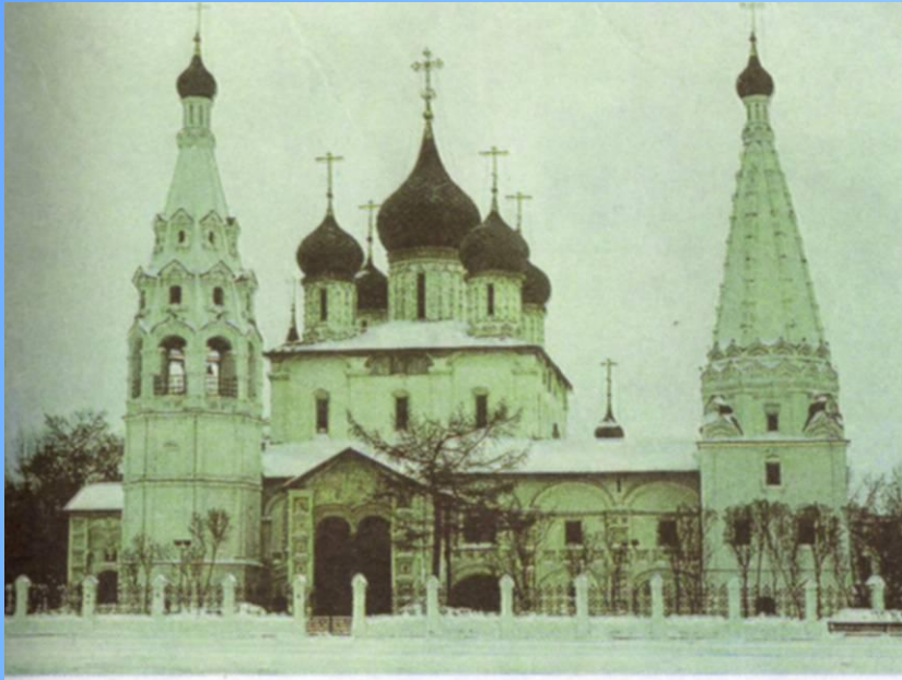
Церковь Покрова в Филях. Москва. XVII в.

Появление нового стиля в архитектуре, получившего название нарышкинского или московского (многоярусность, декоративная отделка зданий)