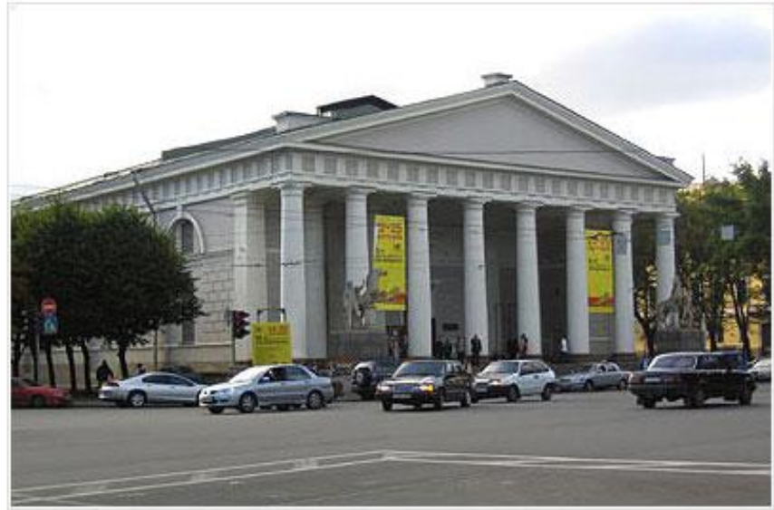
ЦВЗ "Манеж" (Исаакиевская пл., д.1), г. Санкт-Петербург

К 1732 году Ф. Б. Растрелли дают заказ на строительство манежа на пустыре между Невским проспектом и Большой Морской улицей. Заказ даёт Бирон, фаворит императрицы Анны Иоанновны. Именно при ней в 1738 году Растрелли становится обер- архитектором.