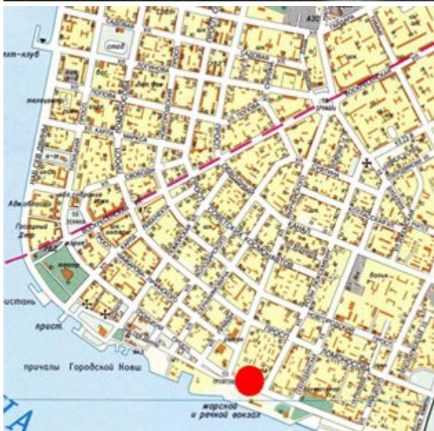
Карта центральной части Архангельска с указанием места расположения Бизнес-центра

Расположение бизнес-центра «Айсберг» является одним из самых сильных его конкурентных преимуществ.