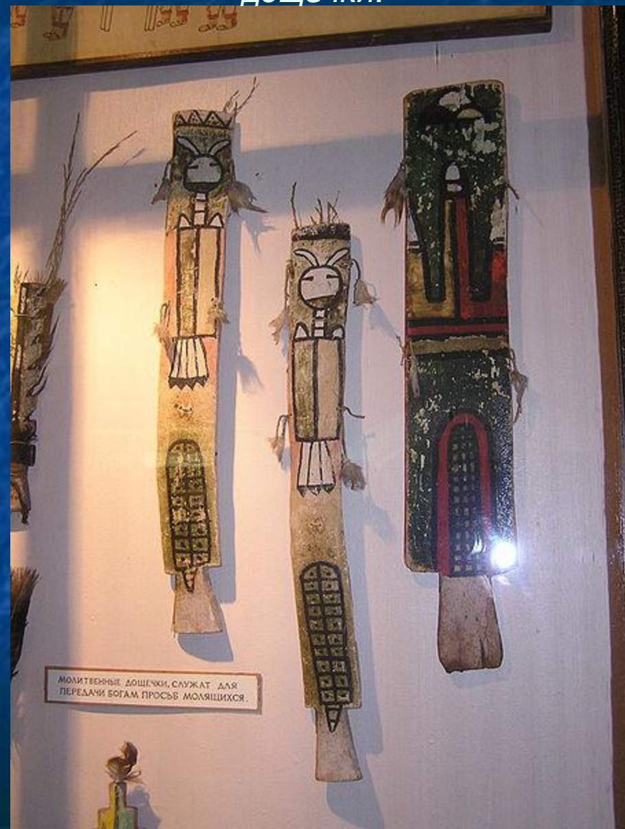
МОЛИТВЕННЫЕ ДОЩЕЧКИ, СЛУЖАТ ДЛЯ ПЕРЕДАЧИ БОГАМ ПРОСЬБ МОЛЯЩИХСЯ.