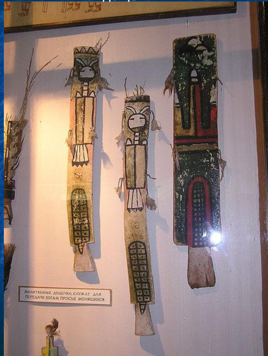
МОЛИТВЕННЫЕ ДОЩЕЧКИ, СЛУЖАТ ДЛЯ ПЕРЕДАЧИ БОГАМ ПРОСЬБ МОЛЯЩИХСЯ.