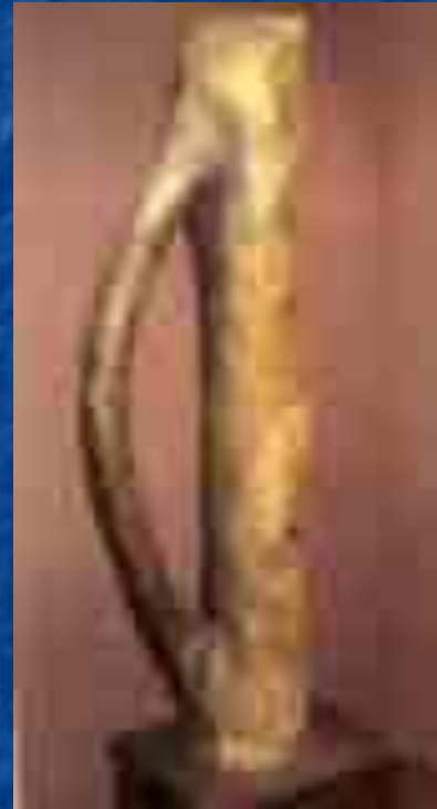
Дерево – монстр.

Однажды, гуляя по заросшему деревьями берегу Невы, царь обратил внимание на необычную сосну. Одна из веток дерева выросла прямо в ствол, как бы образуя дужку большого амбарного замка. Изумлённый Пётр воскликнул: «Вот так дерево- монстр!». Сама природа словно, указывала царю местоположение музея. Он распорядился срубить готовый экспонат, а на этом месте построить здание Кунсткамеры.