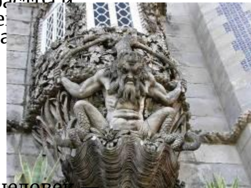
Деталь фасада — Тритон, получеловек полурыба