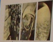
Это человек облетел всю планету.

12 апреля 1961 года в Советском Союзе совершил свой первый полет в космос человек - Юрий Алексеевич Гагарин. Он стал первым человеком, вышедшим в открытый космос. Его полет открыл новую эру в освоении космоса.