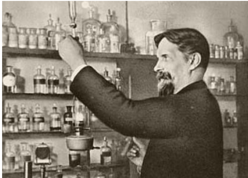
К.А. Тимирязев в лаборатории за работой

Современники Тимирязева сохранили нам образ не педанта, углублённого в свои микроскопы, в свои книги, а человека, открытого всем радостям мира.