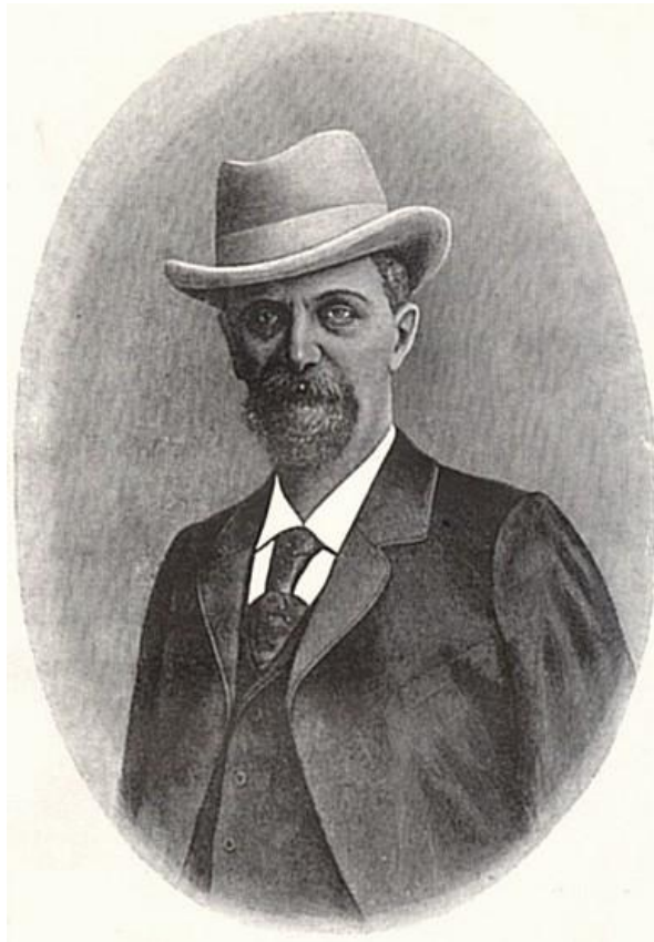
К.А.Тимирязев в 1901 г.

Была в нём и подтянутость, которую привили ему ещё в родительском доме. Она сохранилась на всю жизнь как ненависть ко всякой неряшливости ненависть ко всякой неряшливости, как уважение к труду и умение работать.