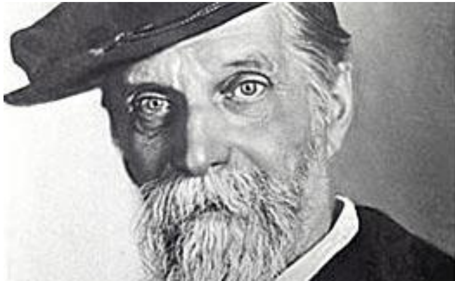
К.А. Тимирязев на отдыхе