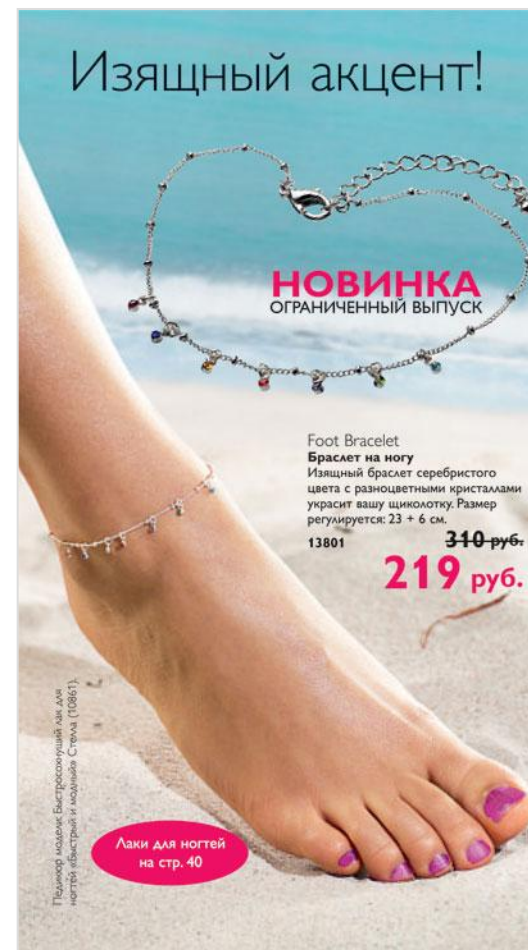
13801 Браслет на ногу