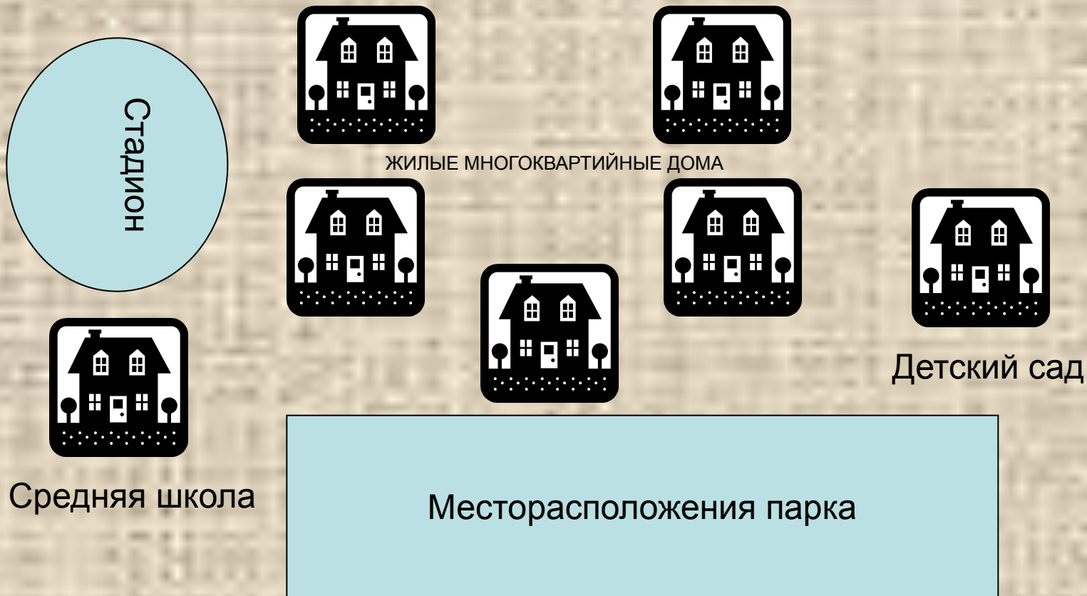
Схема окрестностей парка