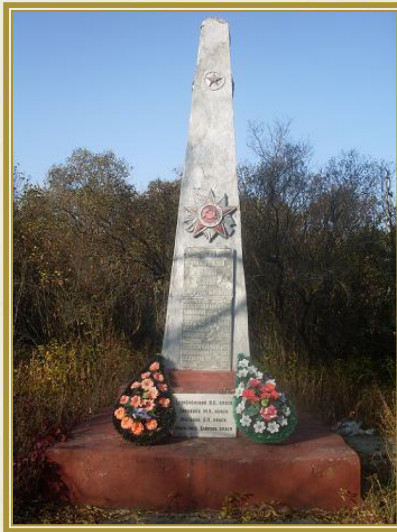
Памятник на территории Дома отдыха.