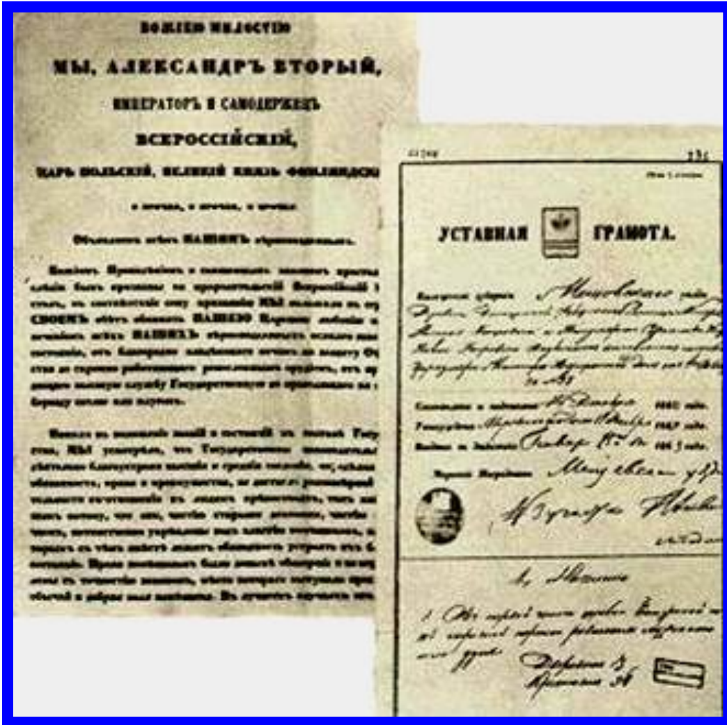
Документы «Великой реформы».

В декабре 1860 г. Проект был рассмотрен в Гос-совете и 19 февраля 1860 г. Александр II подписал «Манифест» и «Положения». Крестьяне становились свободными и наделялись гражданскими правами.