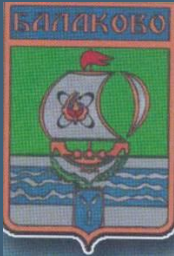
Герб Балаково 80-90 г.г XX века