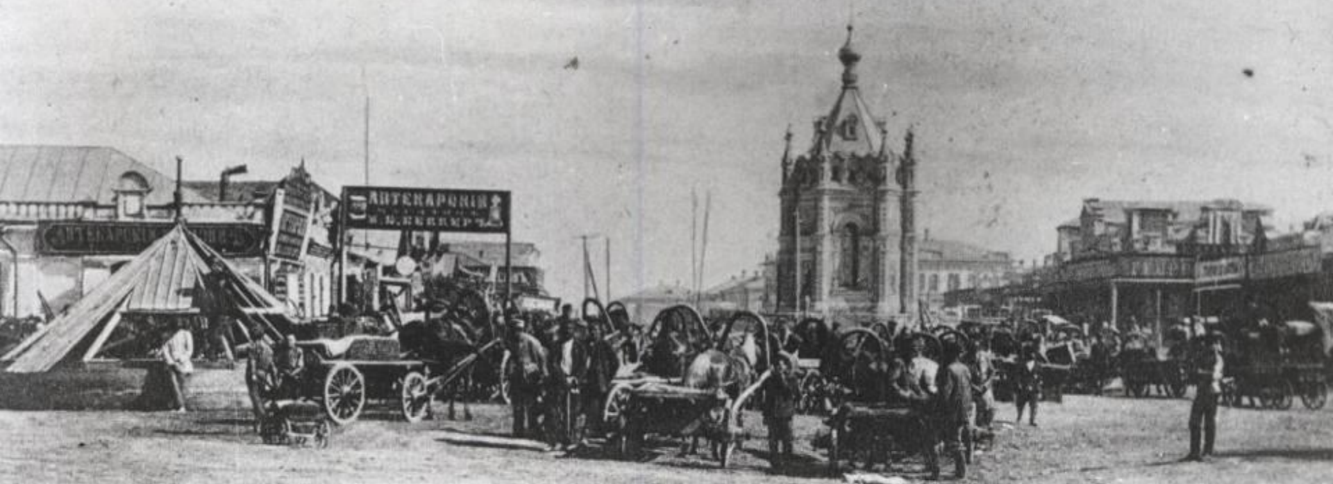
БАЛАКОВО н/В. Биржа Ломовиковъ.

Росло и ширилось село Балаково. Строились храмы и часовни.