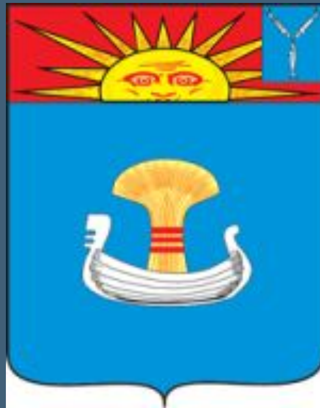
Современный герб Балаково