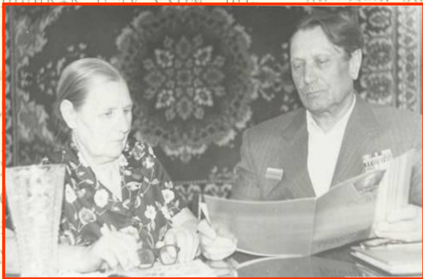
Фото из газеты «Убинский вестник» к статье «Полвека вместе», посвященной золотому юбилею совместной жизни моих прадеда и прабабушки.