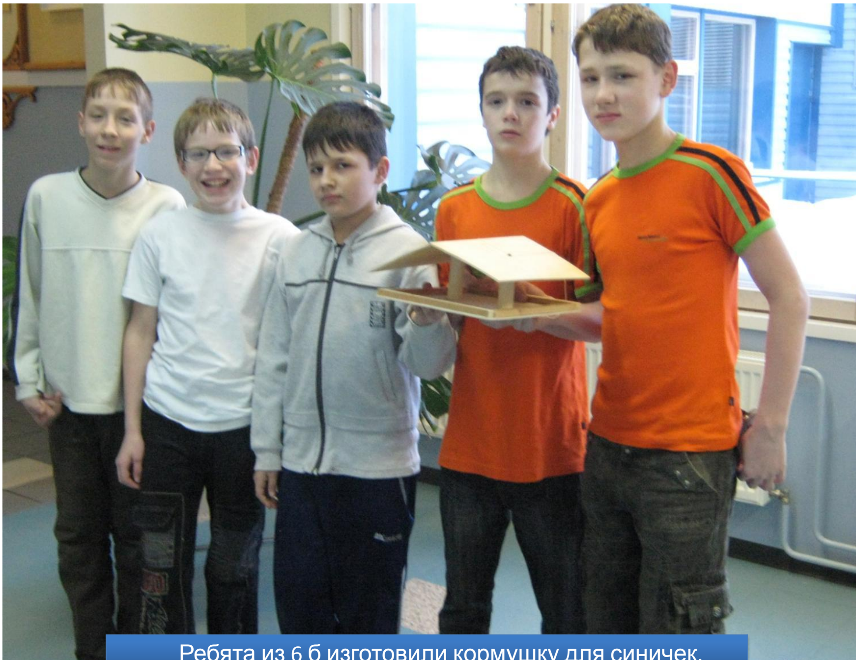
Ребята из 6 б изготовили кормушку для синичек.