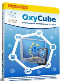
Продукты для смартфонов