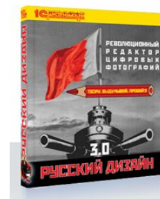
Русский Дизайн 3.0