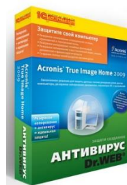
Acronis True Image Home 2009+Антивирус Dr.Web