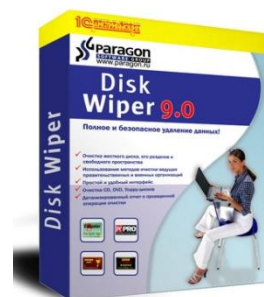
Paragon Drive Backup 9, Paragon Домашний Эксперт 2009, Paragon Disk Wiper 2009