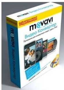
Movavi AudioSuite и Видео Конвертер 8