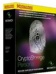
Infowatch CryptoStorage Защита персональной информации