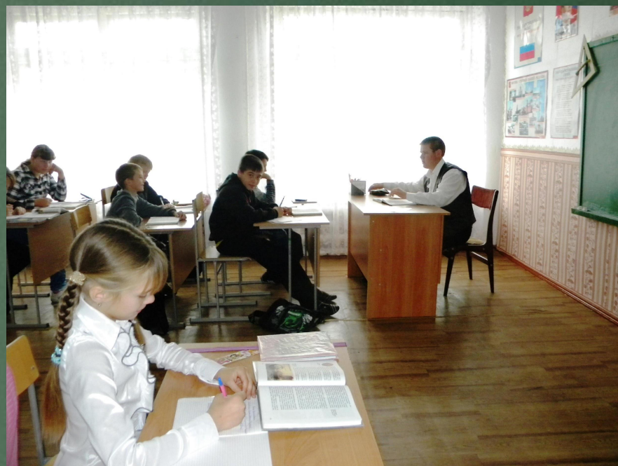
Да, нелегкая эта работа – учитель! Но такая интересная и ответственная!