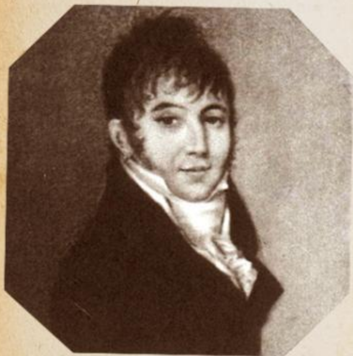
С.Н.Грибоедов - отец поэта