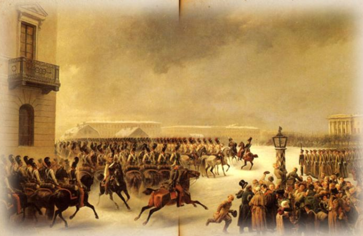
Восстание декабристов 1825 год