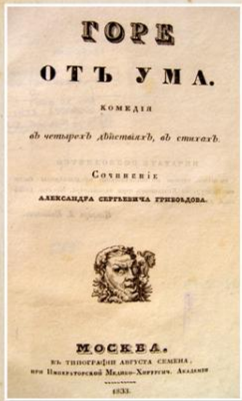
Первое издание Горя от ума