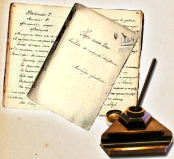
Рукопись Горя от ума