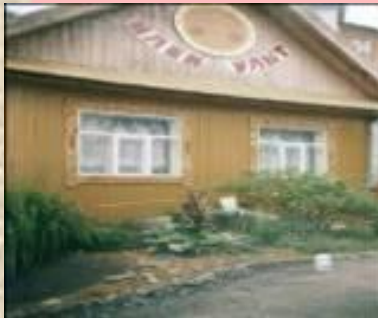
Дом сказок «Илен улыт»