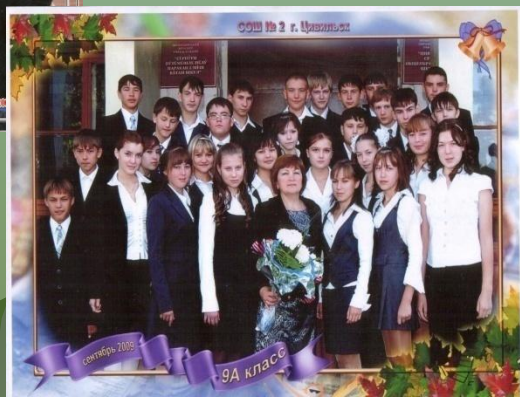
СОШ №2 г. Целиноград