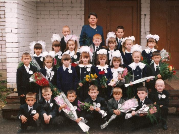
школа №2 Любимой школе - 60 лет!