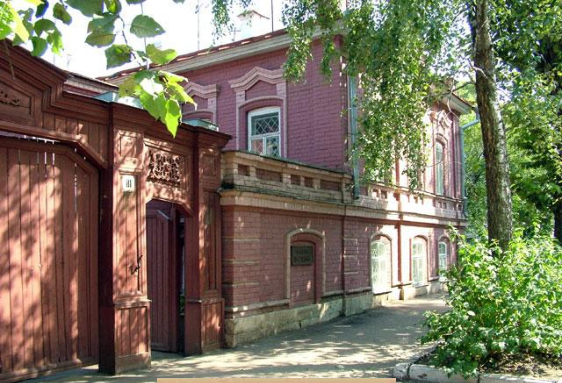
Музей Бориса Пастернака