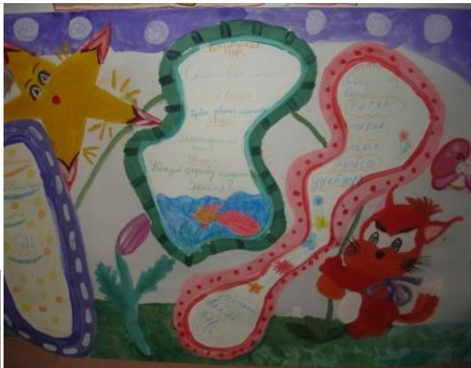
Газета 4б класса