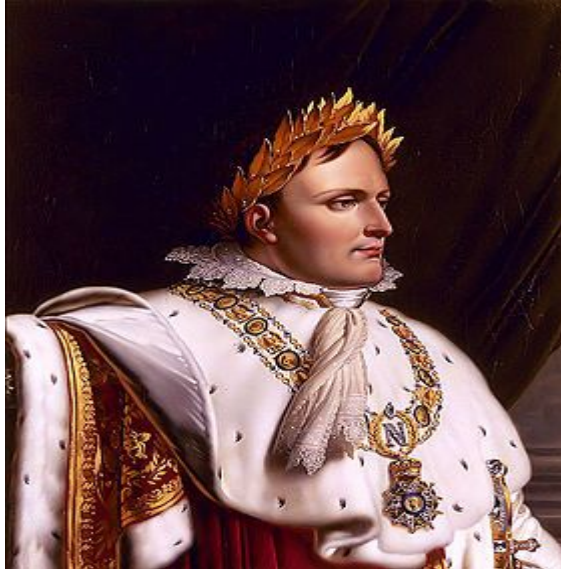
Наполеон в полном императорском облачении