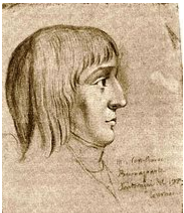
Наполеон в возрасте 16 лет (рисунок мелом неизвестного автора)