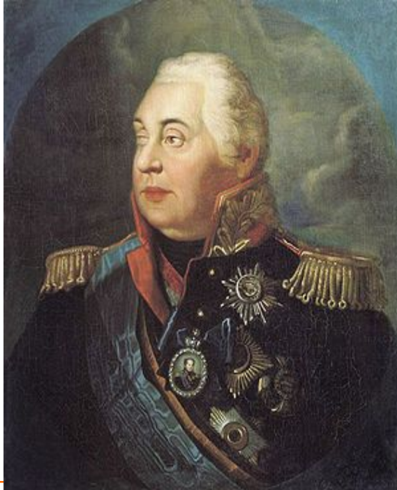
Портрет М.И. Кутузова кисти Р.М. Волкова