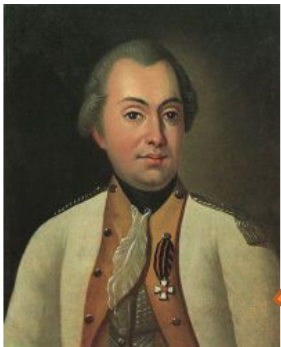
Портрет М.И. Кутузова в мундире полковника Луганского пикинерного полка