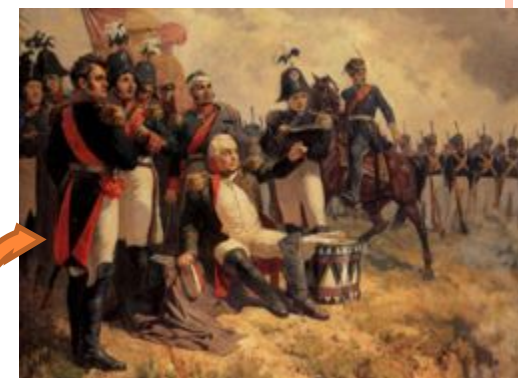
Кутузов во время Бородинской битвы. А. Шепелюк, 1951 г.