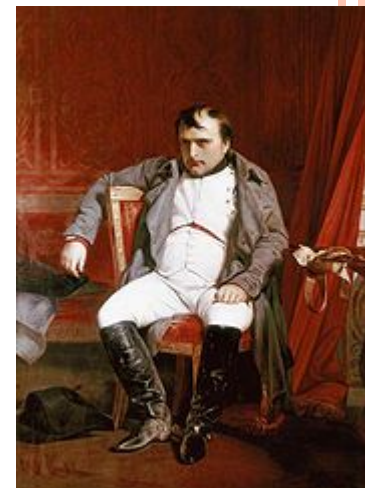
Наполеон Бонапарт после отречения во дворце Фонтенбло Поль Деларош