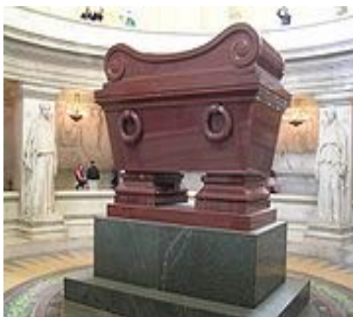
Гробница Наполеона в Доме Инвалидов