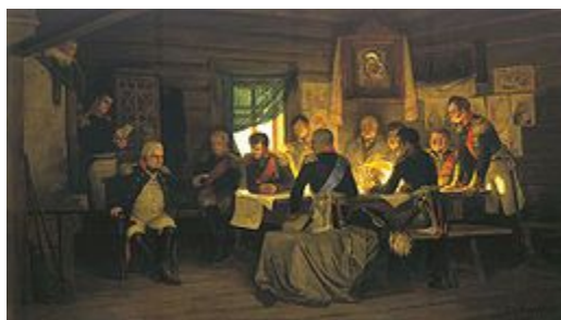
Военный совет в Филях. А.Д. Кившенко, 18** г.