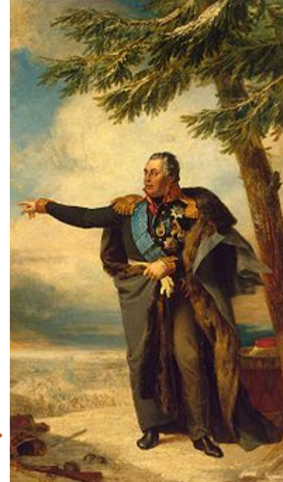
Портрет М.И. Кутузова. Д. Доу, 1829