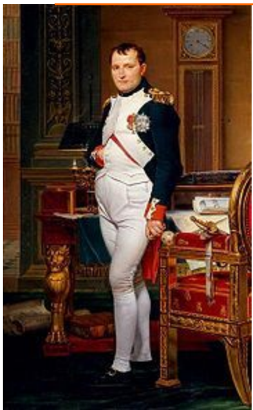
Наполеон в своём кабинете. Жак Луи Давид (1812).