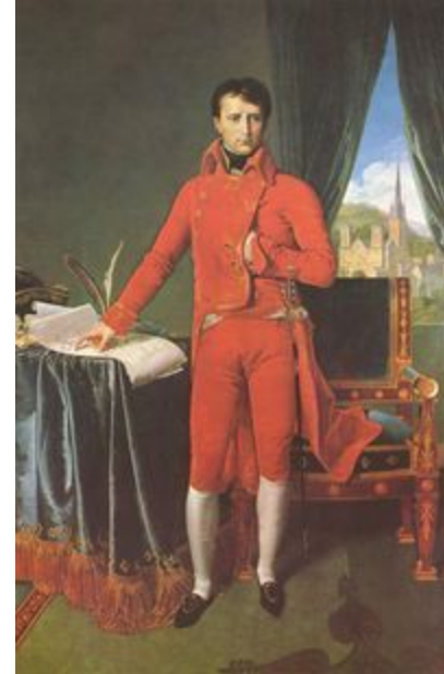
Бонапарт — первый консул, художник Энгр, Жан Огюст Доминик